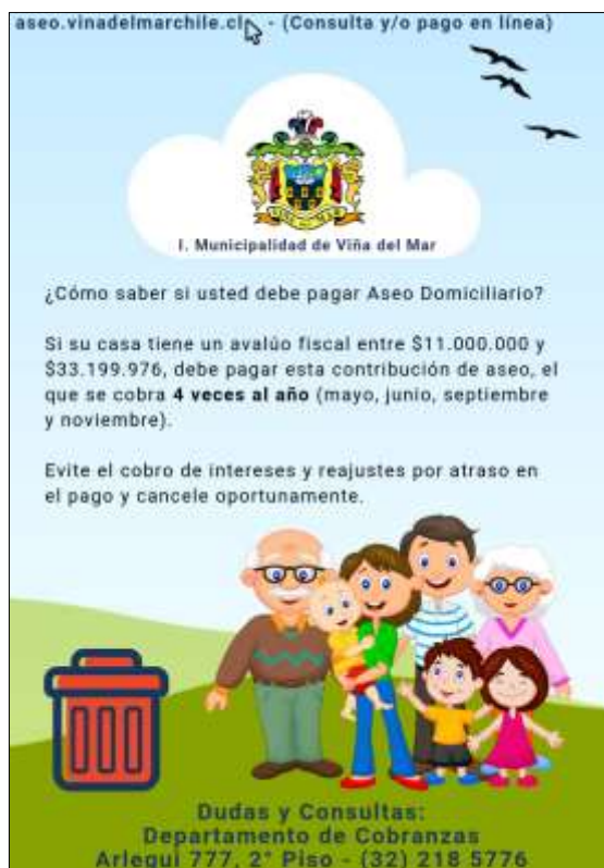
Afiche o flyer Informativo de Aseo Domiciliario