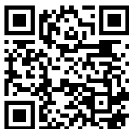
Pago en línea Patentes Municipales