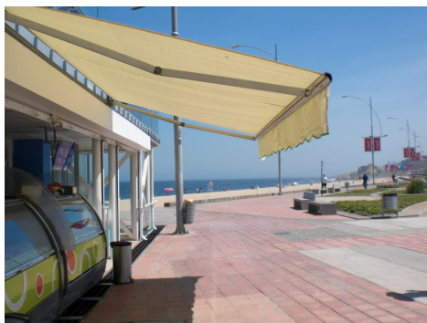
Playa Los Marineros Norte