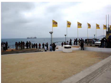
Playa Caleta Abarca