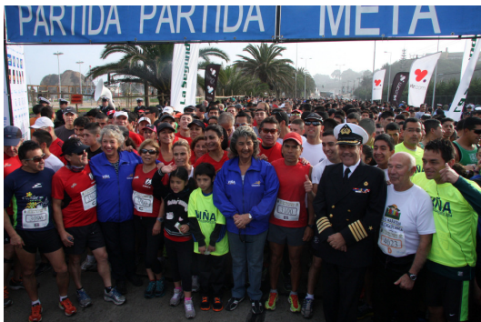
CORRIDA FAMILIAR MES DEL MAR