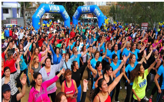
LANZAMIENTO AFA 2013